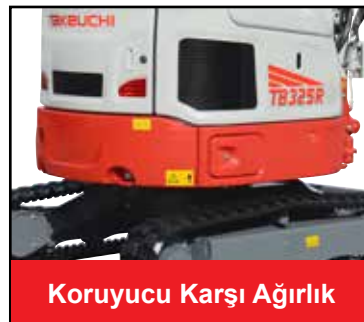
Koruyucu Karşı Ağırlık