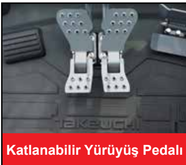
Katlanabilir Yürüyüş Pedalı

* Kop sistemli özel dizayn kovalar sayesinde ulaşılan kazı gücüdür.