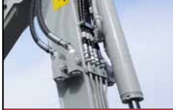
4 Adete Kadar Servis Portu (isteğe bağlı)