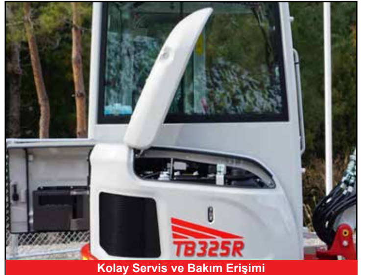
Kolay Servis ve Bakım Erişimi

*Fonksiyonlar, ülkeden ülkeye değişiklik gösrebilir, kesin bilgi için lütfen ülkenizdeki Takeuchi yetkilisi ile temasa geçiniz"