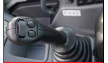
Hidrolik Joystik Kontrolleri

TB325R, Takeuchi'nin 300 Serisi ekskavatör yelpazesine en son eklenen modeldir. Bu yeni model iyice azaltılmış kuyruk çıkıntısı sayesinde çok kısa bir dönüş alanına sahiptir, bu da TB325R'ye eşsiz bir manevra kabiliyeti vererek dar alanlarda mükemmel üretkenlik sağlar. Kompakt boyutları ve hafifliği sayesinde, TB325R kolayca taşınabilir.