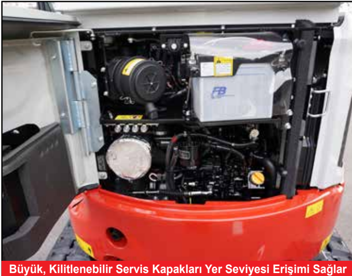
Büyük, Kilitlenebilir Servis Kapakları Yer Seviyesi Erişimi Sağlar