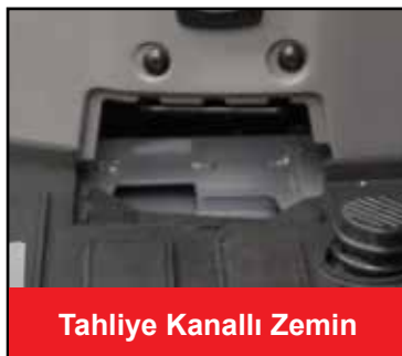
Tahliye Kanallı Zemin