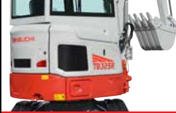
Dar Alanda Kolay Manevra