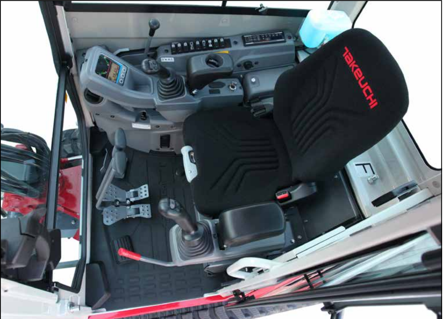
Kolay Erişilir Kumandalara ve Anahtarlara Sahip Geniş Operatör Kabini

TB325R'deki standart özellikler arasında yakıt sisteminin manüel olarak havasının alınması gerekliliğini ortadan kaldıran bir otomatik yakıt hava alma sistemi, yakıt tasarrufuna yardımcı olan otomatik rölanı, kolay temizlik sağlayan zemindeki tahliye kanalları ve makinenin kritik parçalarını çevre sararak, iç aksamaların korunmasını sağlayan arka ağırlık bulunur.