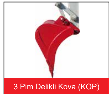
3 Pim Delikli Kova (KOP)